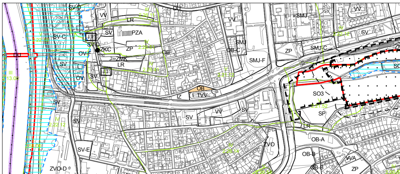
Návrh změny s vyznačením hranic BPEJ M 1 : 10 000