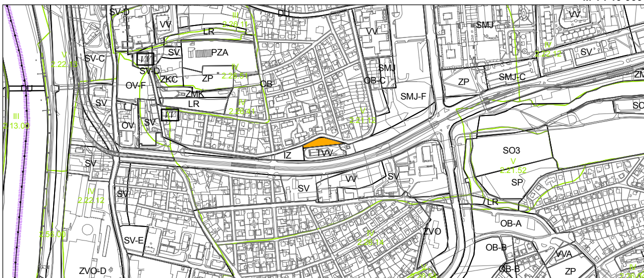
Zákras zadání změny schválený usnesením ZHMP č 35/06 ze dne 23.2.2006, s vyznačením hranic BPEJ M 1 : 10 000